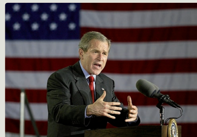
Nicht nur von Islamisten, sondern auch von US-Politikern wurde religiöse Rhetorik in jüngster Zeit gebraucht, um zu Gewalt aufzurufen bzw. sie zu rechtfertigen.

Die Loslösung staatlicher Herrschaft aus religiösen Bindungen ist eine relativ neue Entwicklung, die stets politische Ursachen hatte. Erst nach der japanischen Niederlage im Zweiten Weltkrieg gab etwa der Tenno seinen Anspruch auf, göttlich zu sein und überließ die Regierungsgeschäfte fortan gewählten Volksvertretern. In China übernahmen 1949 die Kommunisten die Macht und setzten eine rein weltliche Ideologie durch. Auch in Indien herrschten jahrhundertlang lokale Dynastien unterschiedlicher religiöser Ausrichtung. Erst 1947 – nach dem Ende der britischen Herrschaft, die das Land vereint hatte – erhielt es eine säkulare Verfassung.