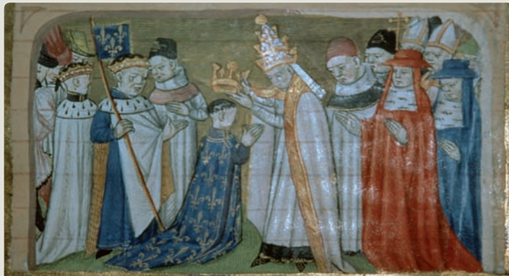
Seit den Karolingern beanspruchten die abendländischen Herrscher, von Gott legitimiert zu sein (Krönung Karls des Großen durch Papst Leo III. im Jahr 800).

Weltliche Herrschaft und religiöse Führung waren lange Zeit eng miteinander verbunden. Häufig übernahmen Stammesführer und Könige auch die Aufgabe des obersten Priesters. Die Gemeinschaft galt als unteilbarer Einheit, in der der Religion in allen Lebensbereichen eine große Bedeutung zukam. Nach dem Entstehen organisierter Staatswesen in der nachantiken Welt änderte sich daran zunächst wenig. Die europäischen Herrscher unterstanden über Jahrhunderte den Weisungen des Papstes und erhielten durch ihn ihre Legitimation als von Gott eingesetzte Staatsoberhäupter. Erst als die Kirche ihre Vorrangstellung einbüßte und die Staaten sich säkulare Verfassungen gaben, erfolgte eine Trennung von Religion und Politik. Doch nicht nur islamische Länder besinnen sich neuerdings wieder verstärkt auf ihre religiösen Traditionen. Auch im christlichen Einflussbereich spielt Religion und Glaube in der Politik immer noch eine Rolle.