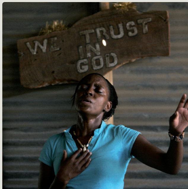
Christen bekennen sich zu dem Glauben an Gott, den Vater, Jesus Christus, den Sohn, und den Heiligen Geist.

Im Laufe seiner Entwicklung spaltete sich das Christentum in mehrere Konfessionen, welche wiederum in zahlreiche Gemeinschaften unterteilt sind. Die Ursache dafür lag in den unterschiedlichen Ansichten zu zentralen theologischen Fragen. Anfangs bestand noch weitgehende Einigkeit. Wer sich zu Jesus und seiner Lehre bekehren wollte, ließ sich taufen. Das Eintauchen ins Wasser versinnbildlichte die Tilgung der Erbsünde und