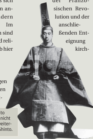
1945 erklärte Kaiser Hirohito öffentlich, dass der Tenno nicht göttlich sei. Er ist jedoch weiterhin oberster Priester des Shinto.

Dagegen können die USA auf eine lange Tradition der Trennung von Religion und Politik zurückblicken. Als Zufluchtsort für verfolgte religiöse Minderheiten hatte das Land bereits 1789 die strikte Trennung von Staat und Religion in der Verfassung verankert. In Europa verlor die Kirche ihre Oberhoheit erst im 19. Jh. infolge der Französischen Revolution und der anschließenden Entseignung kirch-