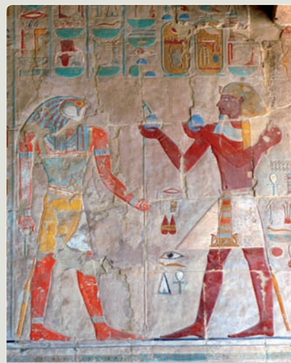
Der Pharao galt als Sohn des Re und fungierte als Mittler zwischen Menschen und Göttern (hier Thutmosis III., der dem falckenköpfigen Gott Re-Harachte ein Opfer bringt).

In den Reichen des Alten Orients hatten die politischen Führer zugleich die Funktion eines Richters, Feldherrn und Oberpriesters inne. Sowohl bei den Sumerern als auch bei den Assyriern und Babyloniern leiteten die Könige ihren Machtanspruch auf ihre Einsetzung durch die Götter ab. Gleichzeitig waren sie ihnen verantwortlich und mussten für die korrekte Durchführung der Rituale sorgen. Ein solches sakrales Königtum gab es auch bei den Inkas,