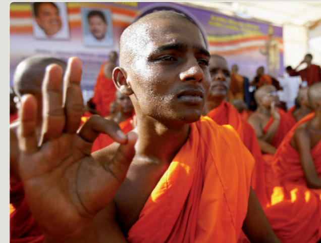
Buddhisten bekennen sich nicht zu einem oder mehreren Göttern, sondern zu Buddha, seiner Lehre und der Gemeinschaft der Gläubigen.

Generell gelten fünf Glaubensgebote: der Glaube an Allah als einzigem Gott, an die Engel und Propheten, an die Offenbarung sowie an das jüngste Gericht. Das Hauptdogma stellt jedoch die Schahada dar, die zugleich die erste der Fünf Säulen des Islam ist.