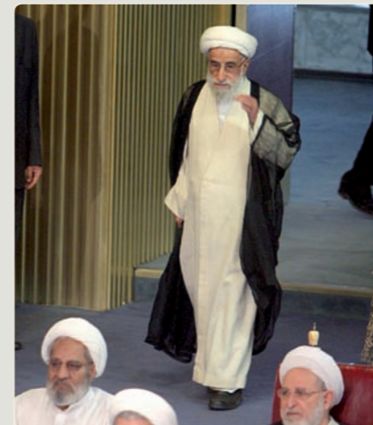
Der Wächterrat überwacht im Iran die Übereinstimmung von Parlamentsbeschlüssen mit dem Islam und kann sie ablehnen.

NEUE RELIGIONEN Die meisten neuen Religionen haben keinen politischen Einfluss; manche streben eine neue Gesellschaft an.